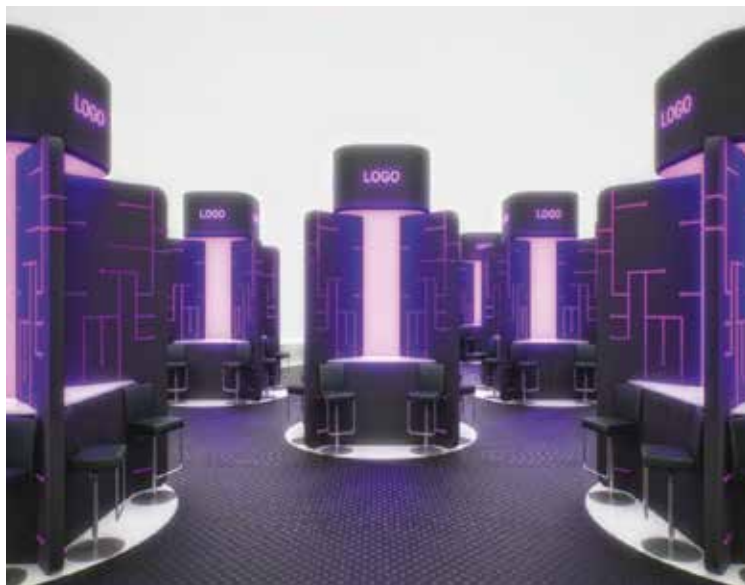
Figura 2 Espaço Startups